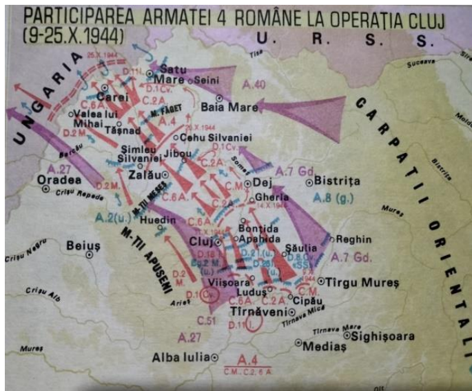
Armata a 4-a și Operațiunea Cluj

Una dintre acțiunile militare de mare importanță a fost „Operațiunea Cluj”, începută de Armata a 4-a Română, la 9 septembrie 1944, pe direcția principală a loviturii aflându-se Corpul 6 Armată. Eliberarea Clujului a fost rezultatul eforturilor eroice făcute de trupele de la aripa stângă a Diviziei 18 Infanterie Munte Română, care a executat o dublă învăluire a inamicului din acest oraș, împreună cu Divizia 2 Munte și Divizia 1 Cavalerie, care au acționat pe la vest de oraș, a unor unități militare sovietice.